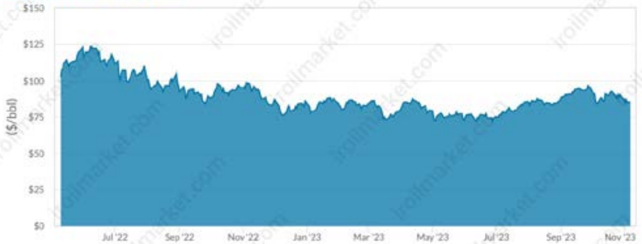
ICE BRENT CRUDE FUTURES