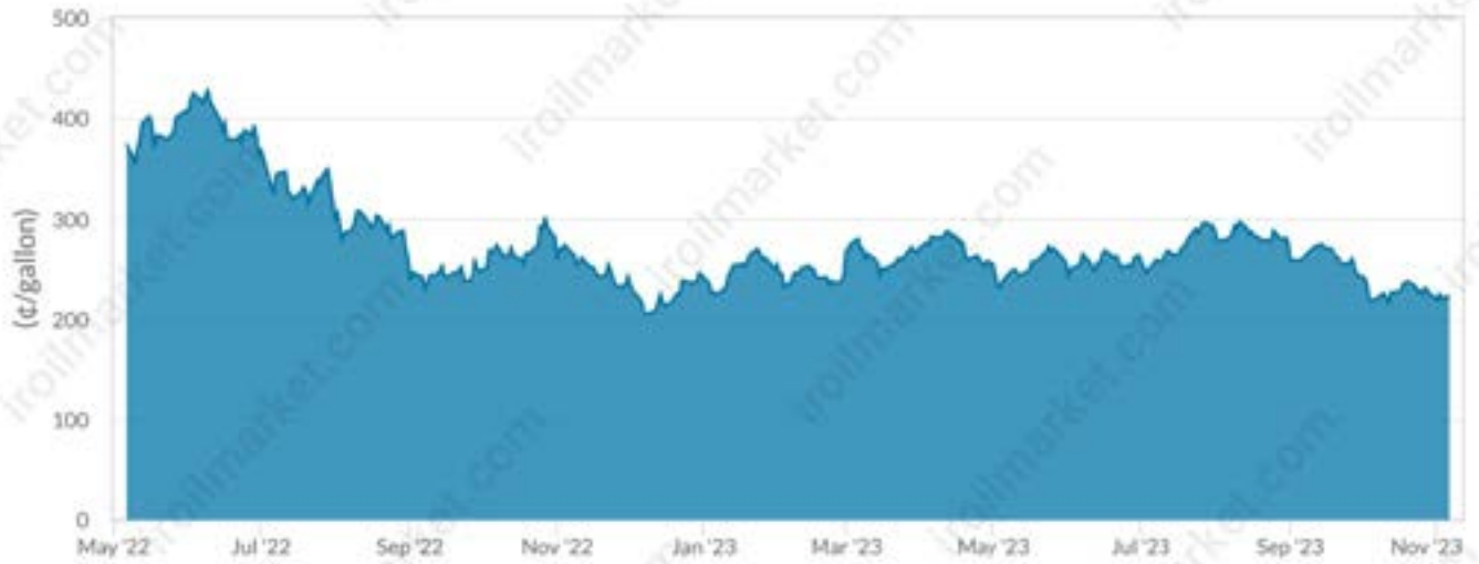
NYMEX GASOLINE FUTURES